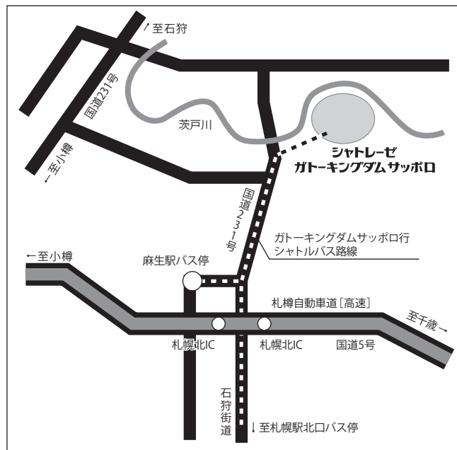
■JR札幌駅北口団体バス乗り場