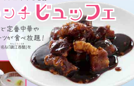
料理長おすすめ 黒酢豚

料理長のおすすめ「黒酢豚」は、中国でも有名な「鎮江香醋」を使った香りとコクがクセになる豚豚です。