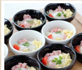
半熟卵とチーズの 山葵ドレッシング