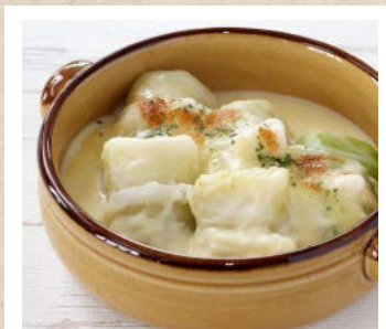
ロールキャベツの チーズグラタン