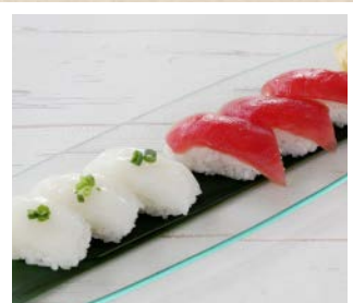
お寿司(イカ・まぐろ)