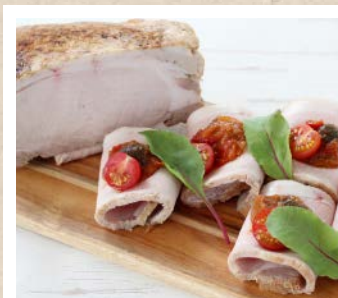
豚ロース肉のバブール ラタトゥユ添え