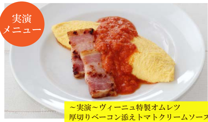
～実演～ヴィーニュ特製オムレツ 厚切りベーコン添えトマトクリームソース