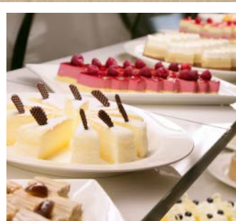
スイーツコーナー