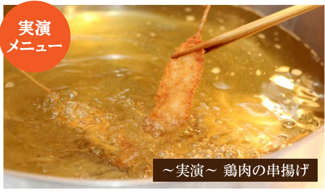
～実演～ 鶏肉の串揚げ