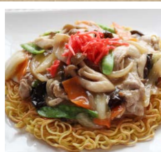
あんかけ焼きそば