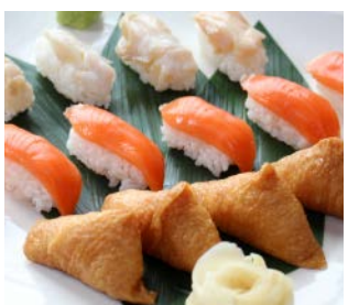
寿司 (ツブ・サーモン・いなり寿司)