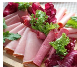
ピアソーセージと ロースハムの盛り合わせ