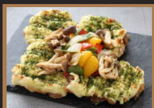
●グリルドチキンの マッシュポテト焼き 青のり風味