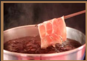
●ワインしゃぶしゃぶ