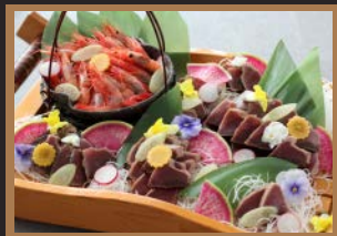
●刺身（カツオ・甘海老）