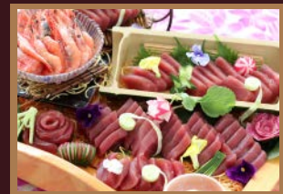
●刺身（マグロ・甘海老）