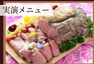
実演メニュー ●北海道産牛肉のローストビーフ