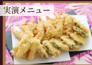
実演メニュー ●天ぷら（エビ・チーズ・野菜）