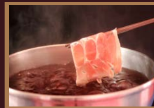
●ワインしゃぶしゃぶ