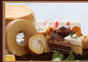
●シャトレーゼスイーツ（ケーキ・アイス）